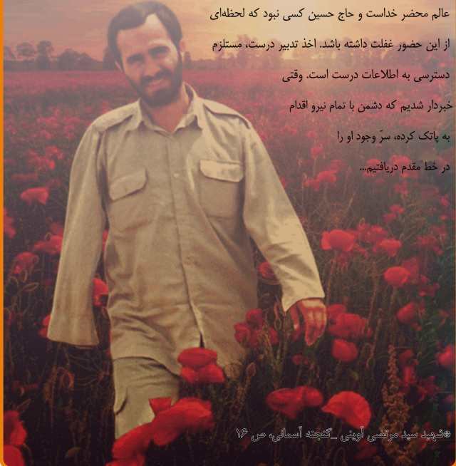
شهادت سید مرتضی اوهنی - گنجینه آسمانی، ص ۱۶